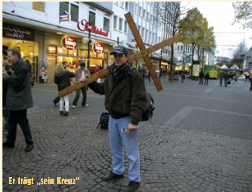
Er trägt „sein Kreuz“

Eph. 6,6 – nicht um den Menschen zu gefallen, sondern weil ihr Knechte Christi seid, die den Willen Gottes von Herzen tun.